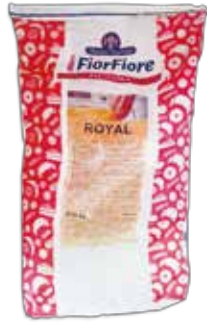
Ref. AMM0809 FIORFIORE CREMA PASTELERA ROYAL saco 10 kg.