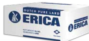
Ref. A01578 MANTECA DE CERDO ERICA caja 12,5 kg.