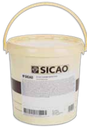
Ref. 043206 CREMA INYECTAR DE CHOCOLATE cubo 25 kg.