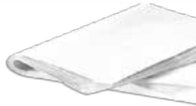
Ref. 006101 RESMA CELULOSA BLANCA ENTERA Y CORTADA 1/2, 1/4, 1/8 caja 5 uds.