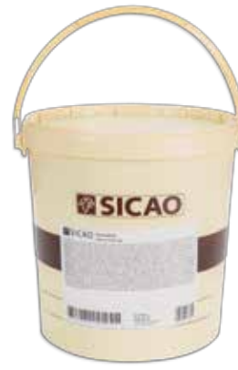
Ref. 043200 CREMA AL HORNO DE CHOCOLATE cubo 25 kg.