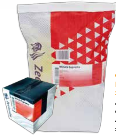
CREMA MINUTA SUPREMA AZE0102 caja 5 Kg. AZE0103 saco 15 kg.