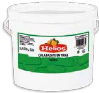
Ref. 033616 CALABACETE VERDE EN TIRAS ESCURRIDO cubo 4 kg.