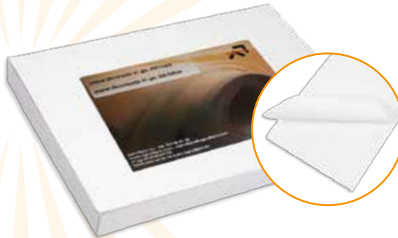
Ref. A03095M PAPEL SILICONADO 60x40 cm. - 41 gr. caja 500 uds.