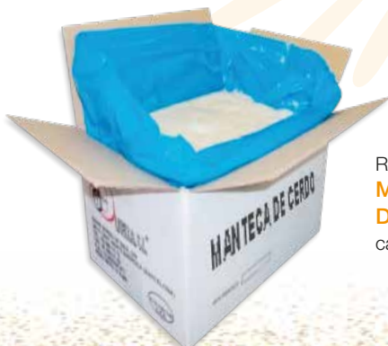
Ref. 035047 MANTECA DE CERDO DURA LAMINAR caja 15 kg.