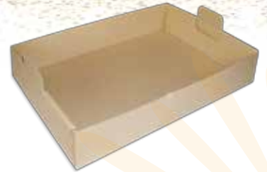
Ref. 007237 CUBETA REPARTO MICROCANAL 35x50x10 cm. paquete 50 uds.