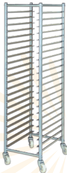
Ref. 012320 ESTANERÍA DESMONTABLE 40 x 60 cm. 22 bandejas