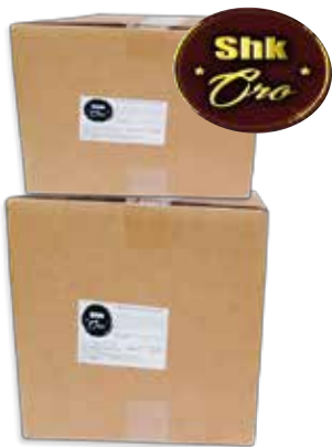
COBERTURA VEGETAL 043095 - 16% - 20 kg. 043097 - 25% - 10 kg.