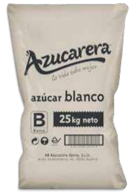
Ref. 035314 AZÚCAR BLANCO saco 25 kg.