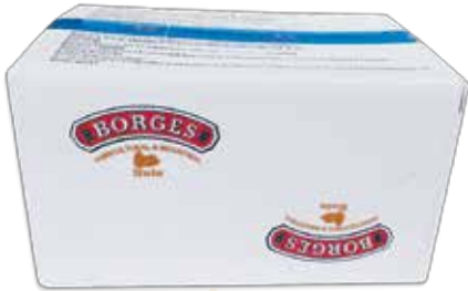
Ref. 036005 ALMENDRA PALITOS caja 10 kg.