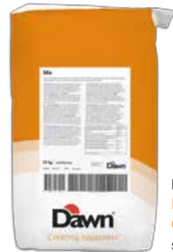
Ref. 042186 BRIOCHE COMPLETO saco 15 kg.