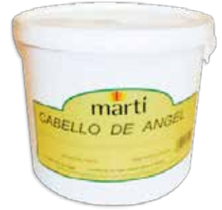
CABELLO DE ÁNGEL AAS0001 - cubo 7 kg. AAS0002 - cubo 14 kg. AAS0003 - cubo 27 kg.