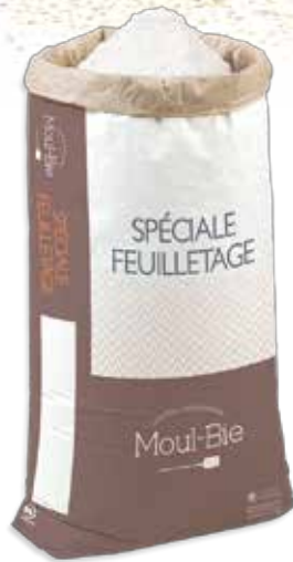
Ref. ED07452 HARINA ESPECIAL HOJALDRE saco 25 kg.