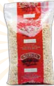
Ref. 036048 PIÑÓN PAÍS caja 10 kg.