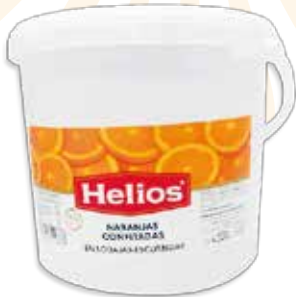
Ref. 033615 DISCOS DE NARANJA ESCURRIDA cubo 4,5 kg.