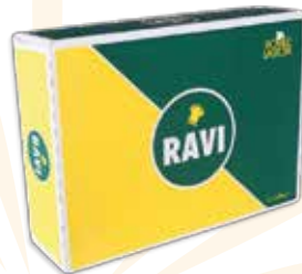
Ref. APQ0002 MARGARINA RAVI HOJALDRE - CROISSANT placas 5x2 kg.