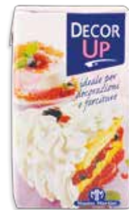
Ref. AMM0702 MIX VEGETAL DECOR UP pack lt. 1x12