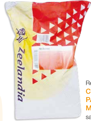
Ref. AZE0101 CREMA PASTELERA MILKREM saco 15 kg.