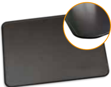
Ref. 012026 BANDEJA DE HIERRO PAVONADA 40 x 60 cm.