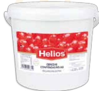
Ref. 033612 CEREZA ROJA A MITADES ESCURRIDA cubo 4 kg.