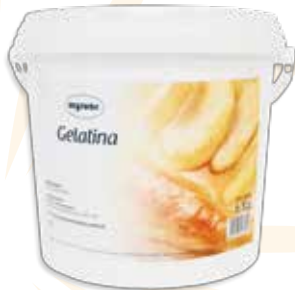
Ref. A02768P BRILLOSOL GELATINA EN FRÍO cubo 6 kg.