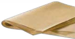
Ref. 006102 RESMA MANILA TABACO ENTERA Y CORTADA 1/2, 1/4, 1/8 caja 5 uds.